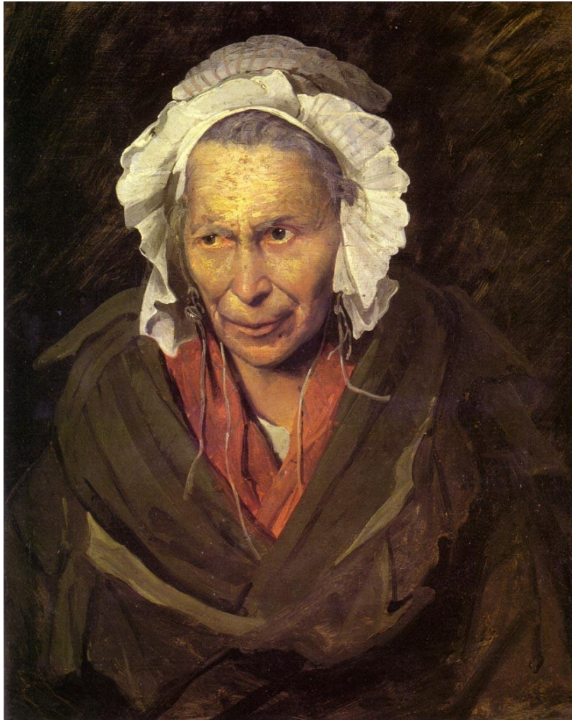
제리코, 미친여인, 1822년, 72-58cm 프랑스 리옹