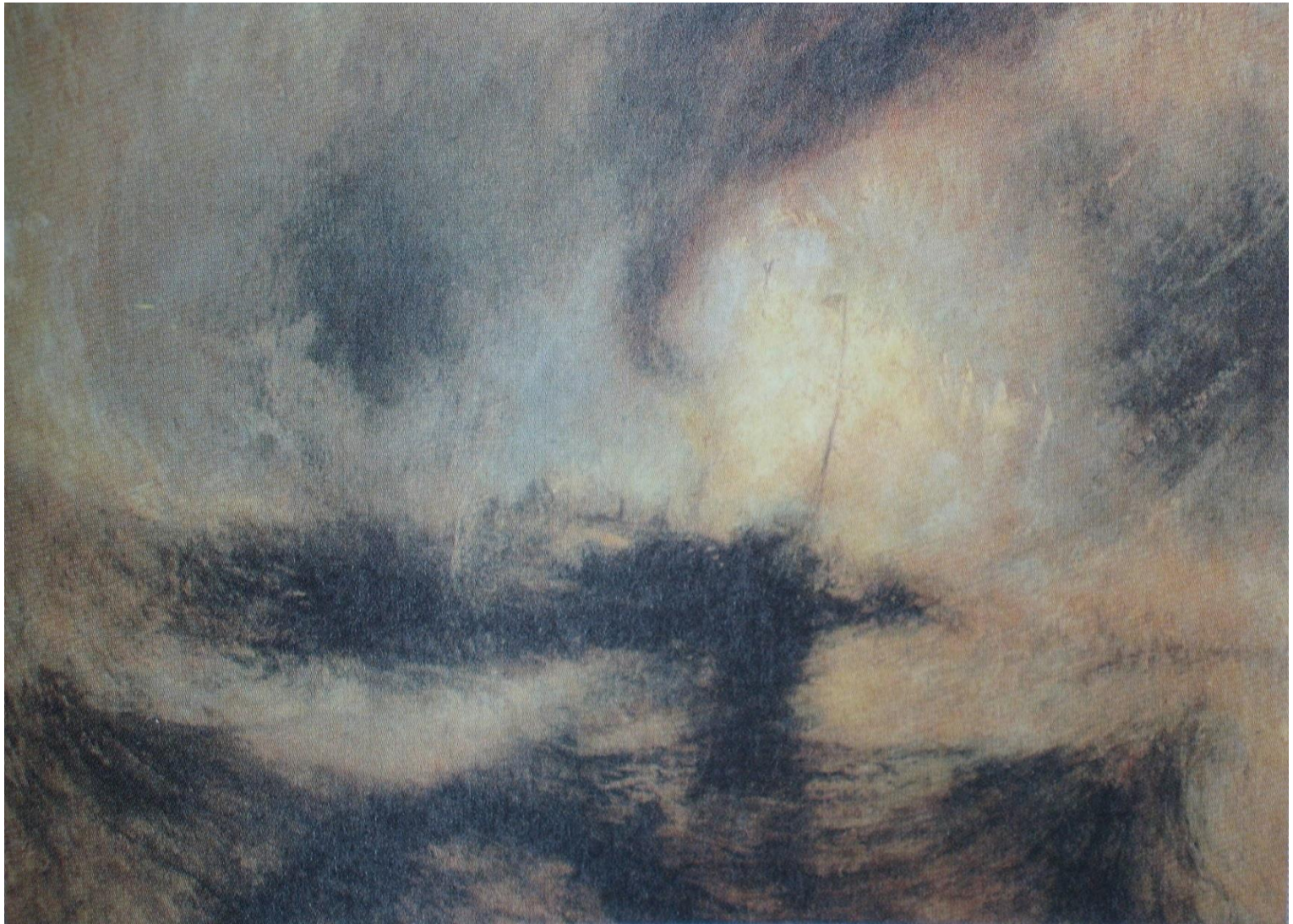
폭풍우, Snowstorm-Steam-Boat off a Harbour's Mouth, 윌리엄 터너, 1842