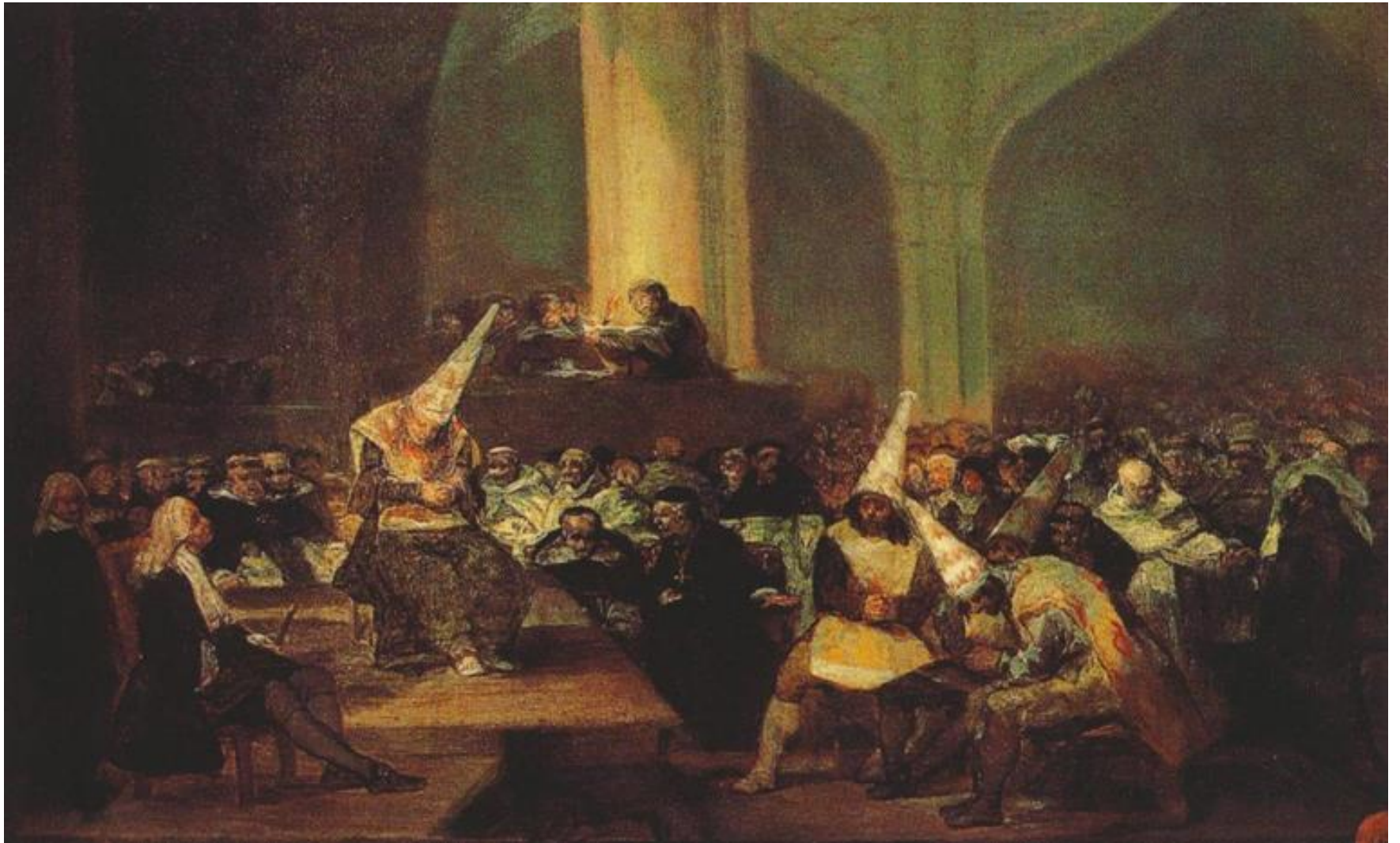
종교비판법정, 1816년, 46-73cm 판넬에 유채, 페르난도 왕립아카데미, 마드리드