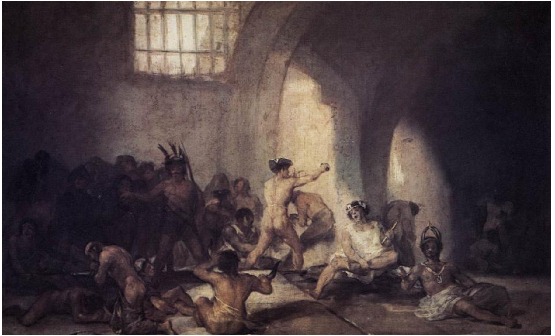
정신병원, 1812-14년, 패널에 유채, 45-72cm, 샌 페르난도 미술아카데미미술관