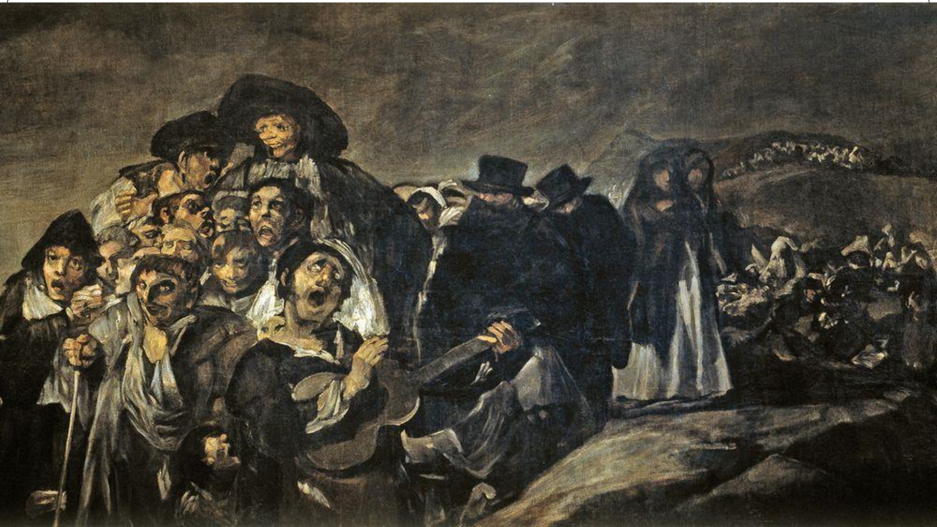
산 이시드로 성지순례, 1819-23년, 1.4-4.4m, 석고에 유채, 캔버스, 프라도미술관 마드리드(부분)