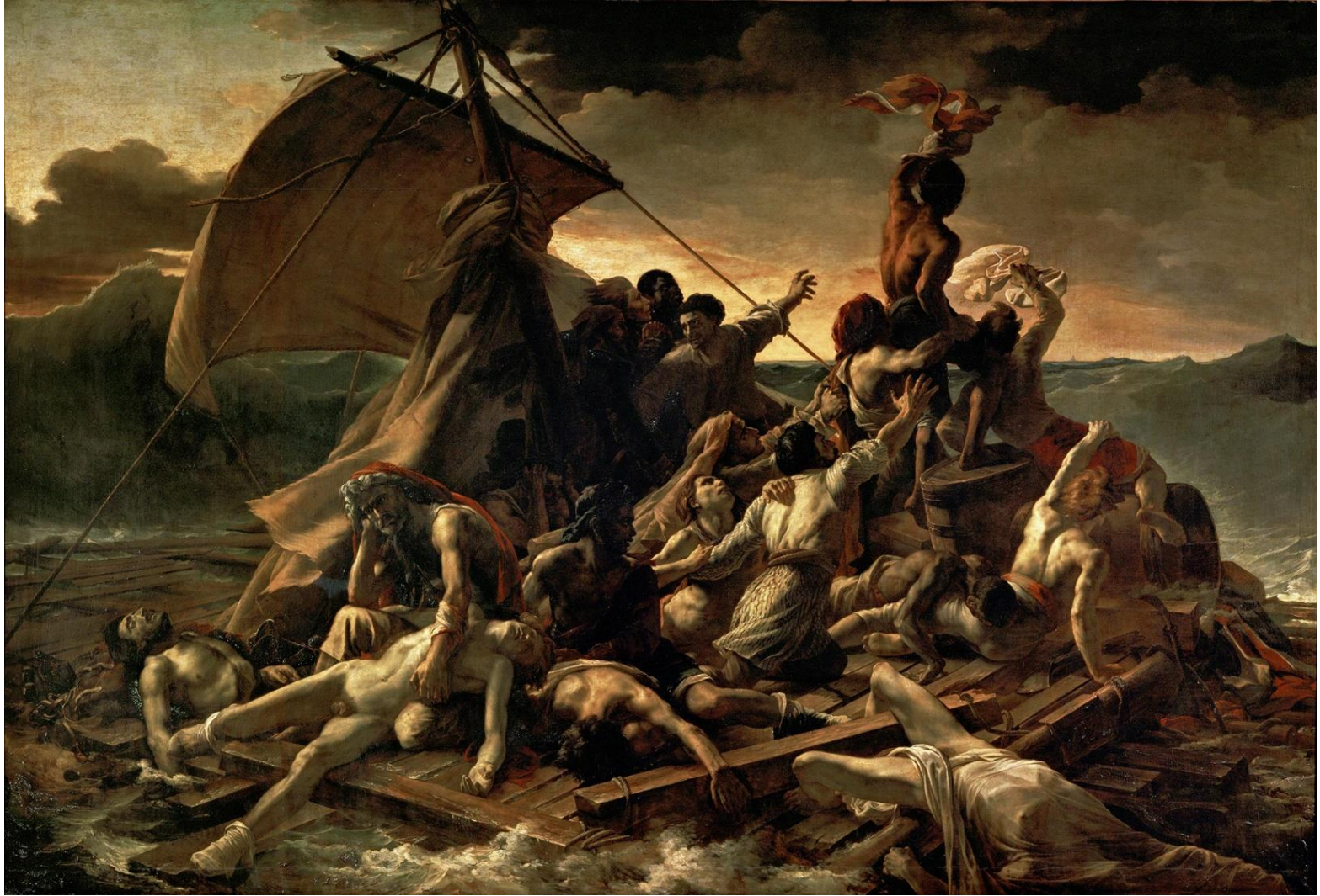
제리코 (Théodore Géricault, 1791-1824) 메뒤스호의 뗏목/캔버스에 유채/716x491cm/1819년/ 파리 루브르박물관