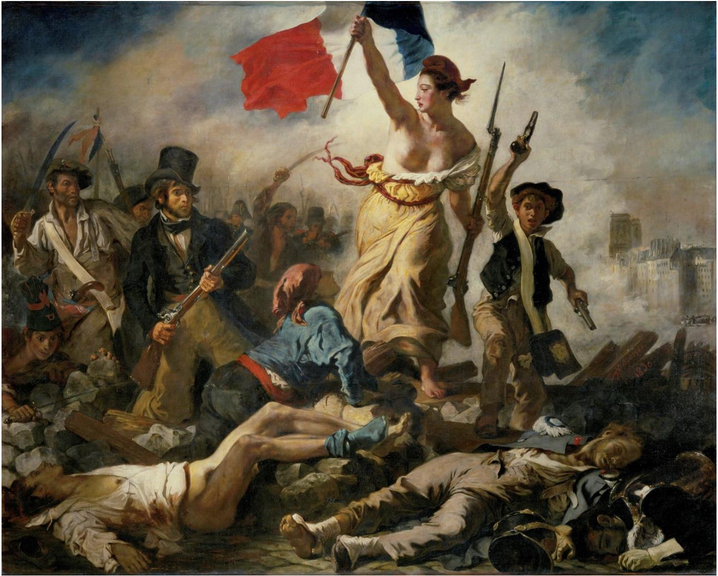
들라크루아, 민중을 이끄는 자유의 여신, 캔버스유채, 1830년, 260-325cm, 파리루브르미술관