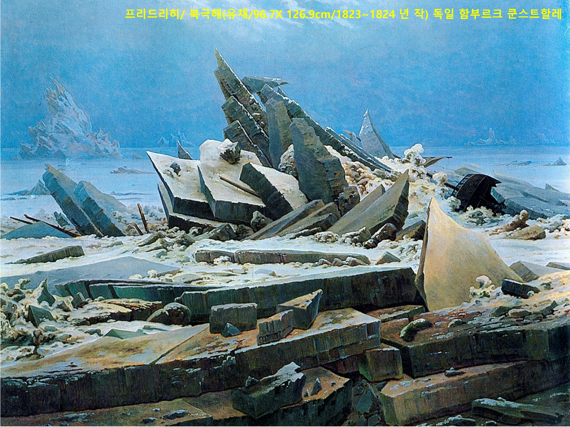
프리드리히/ 북극해(유채/96.7X 126.9cm/1823~1824년 작) 독일 함부르크 쿤스트할레