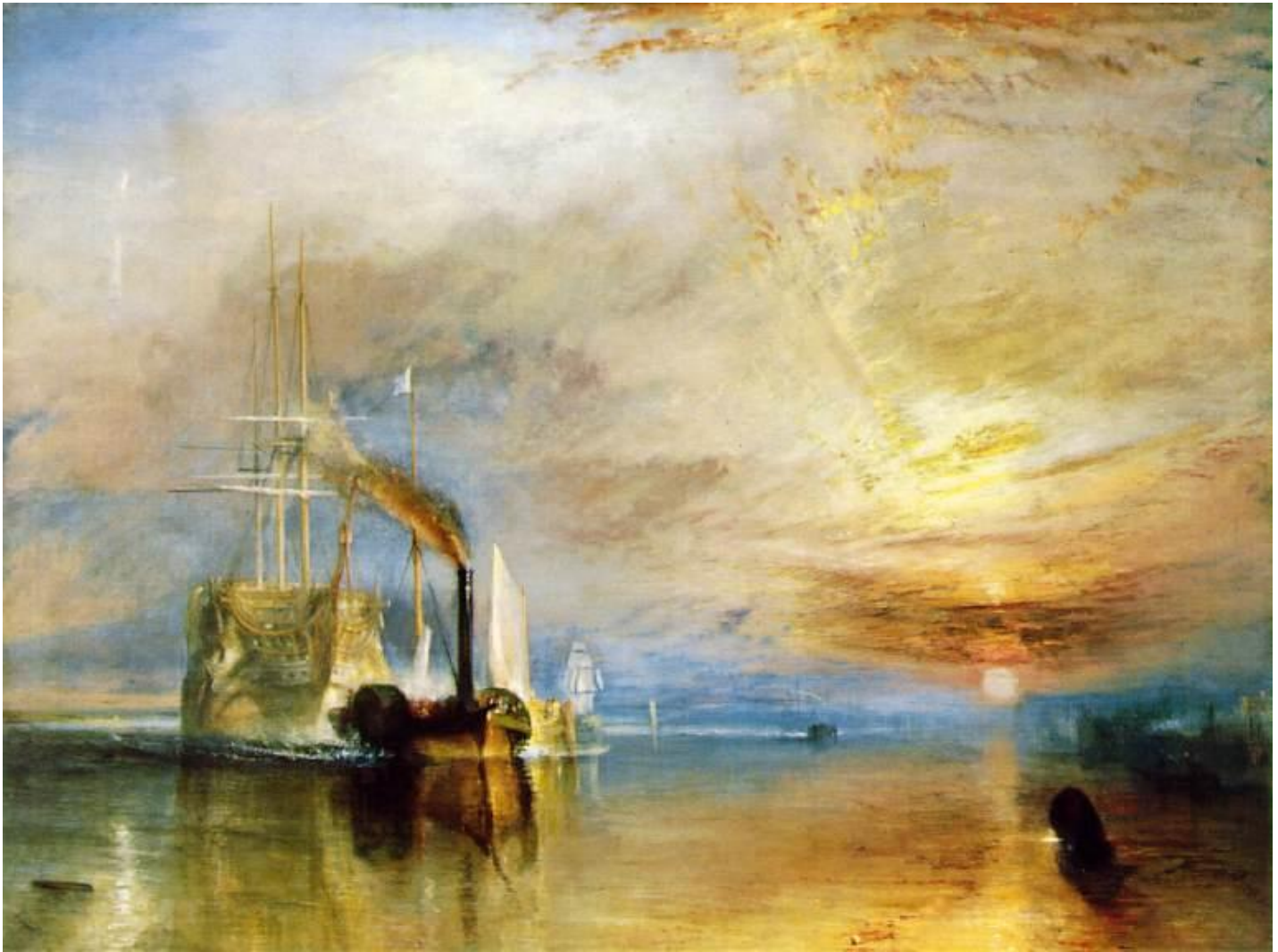
전함 테메레르호, 캔버스 유채, 91-122cm, 1839년, 런던국립갤러리